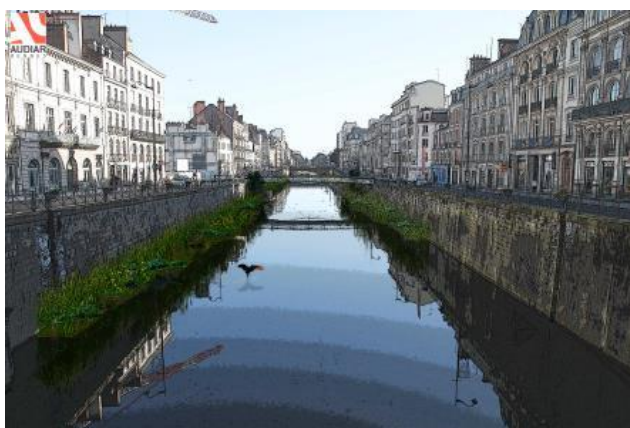
Le projet global vu depuis République vers la passerelle St Germain