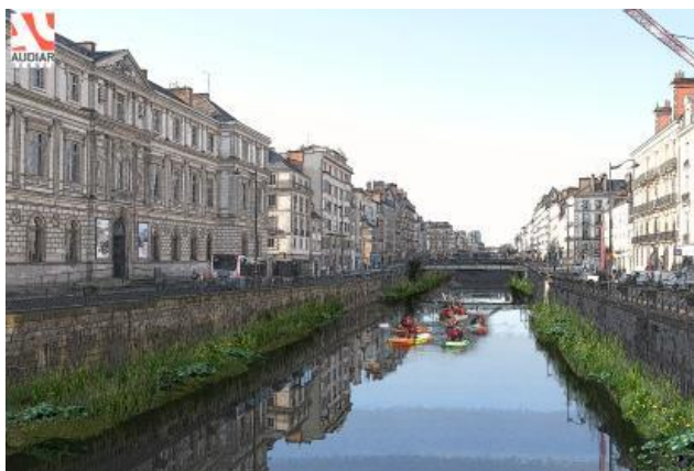
Le projet global vu depuis le pont Pasteur vers la passerelle St Germain

total et révéleront, par leur forme, le cours originel de la Vilaine qui formait alors des méandres. Ils seront fixés aux quais par un système de rails afin de suivre le niveau de l'eau.