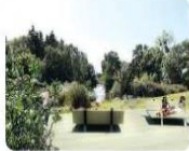
BABELOUSE Espace de repos et table de pique-nique