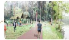
LA CORBINAIS Abri pour une petite halte et chemin stabilisé