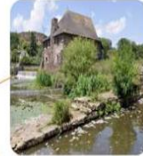
LE BOËL Se promener sur ou au bord de la Vézère