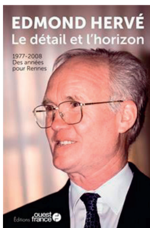
Couverture du livre d'Edmond Hervé

Pour la première conférence de la saison, nous accueillerons Edmond Hervé, ancien maire de Rennes, qui viendra nous parler de son dernier ouvrage "Le détail et l'horizon" paru fin 2021 aux éditions Ouest-France. Il y propose sa vision personnelle de l'histoire de la ville au cours de ses mandats successifs, de 1977 à 2008.