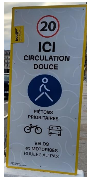
Totem installé aux abords de la station

La signalétique de proximité s'appuie sur des totems facilement repérables et lisibles et un marquage au sol.