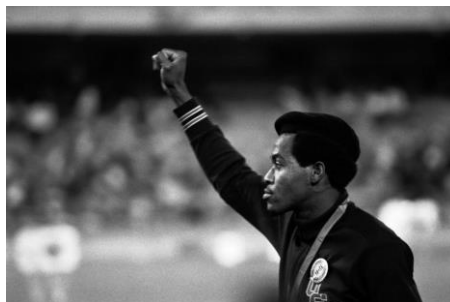
Mexico City. Jeux olympiques. Les athlètes américains manifestent contre la discrimination raciale en levant leur poing fermé. L'athlète américain Lee Evans vainqueur du 400mètres en 43,86 sec. 1968.

Tokyo 1964, Grenoble et Mexico 1968, Munich 1972, Montréal 1976, Moscou 1980 : 6 Olympiades à découvrir en 165 photographies.