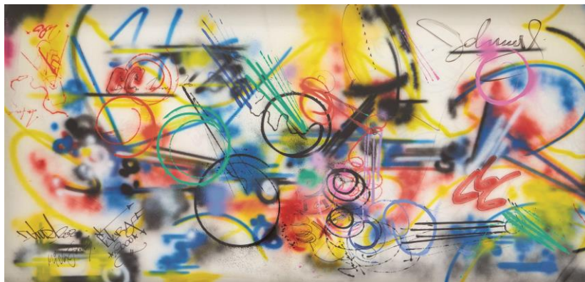
Graffiti de Futura2000 réalisé sur la scène du Bataclan pendant le New York City Rap Tour, 1982, collection particulière ©Adagp, Paris, 2024

« Aérosol » a reçu le label « Exposition d'intérêt national » décerné par le Ministère de la Culture.