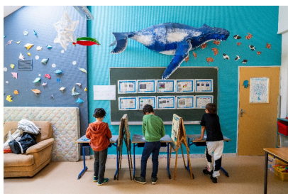
Vote pour le budget participatif des enfants (BPE) à l'école Jean Rostand-Arnaud Loubry Rennes Ville et Métropole

Après instruction des projets par les services de la Ville et validation par le Comité de suivi*, 10 projets ont pu être soumis au vote des enfants les 16 et 17 mai dans quatre écoles (Jean Rostand, Marcel Pagnol, Jeanne d'Arc et Montesso'Rennes). À cette occasion, une carte d'électeur et un bulletin de vote ont été remis à chaque enfant.